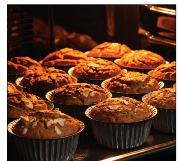
Gardez un œil sur vos aliments depuis l'extérieur grâce à un éclairage halogène vif.