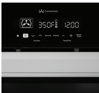
Le panneau de commande tactile est facile à voir et à utiliser.

Avec des décennies d'expérience dans la conception d'appareils de cuisson innovants, il est facile de comprendre pourquoi les cuisiniers du monde entier font confiance à Sharp.