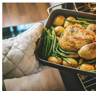
Le plateau coulissant inclus permet de retirer sans effort les plats les plus lourds.